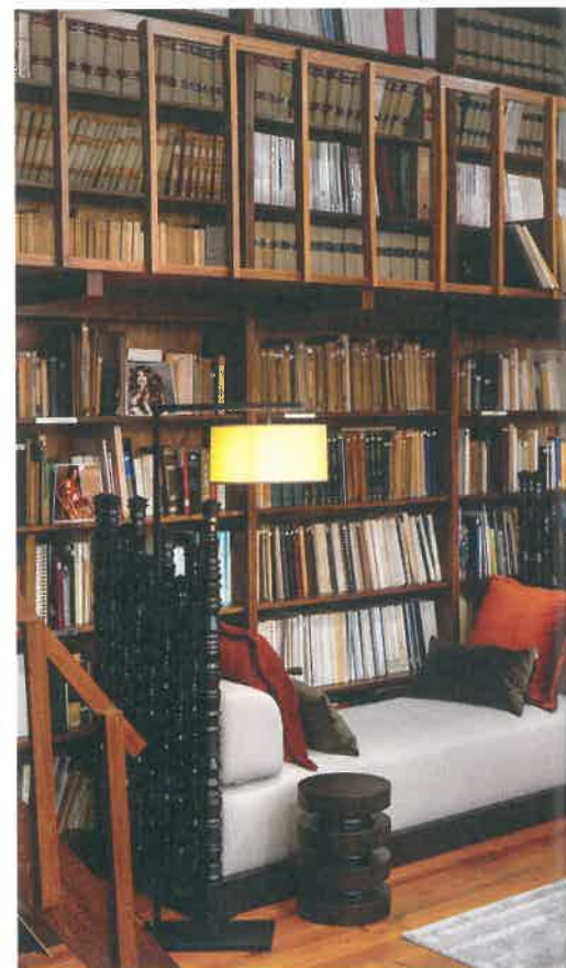
1 Projeto de AM Living x Carlos dos Santos